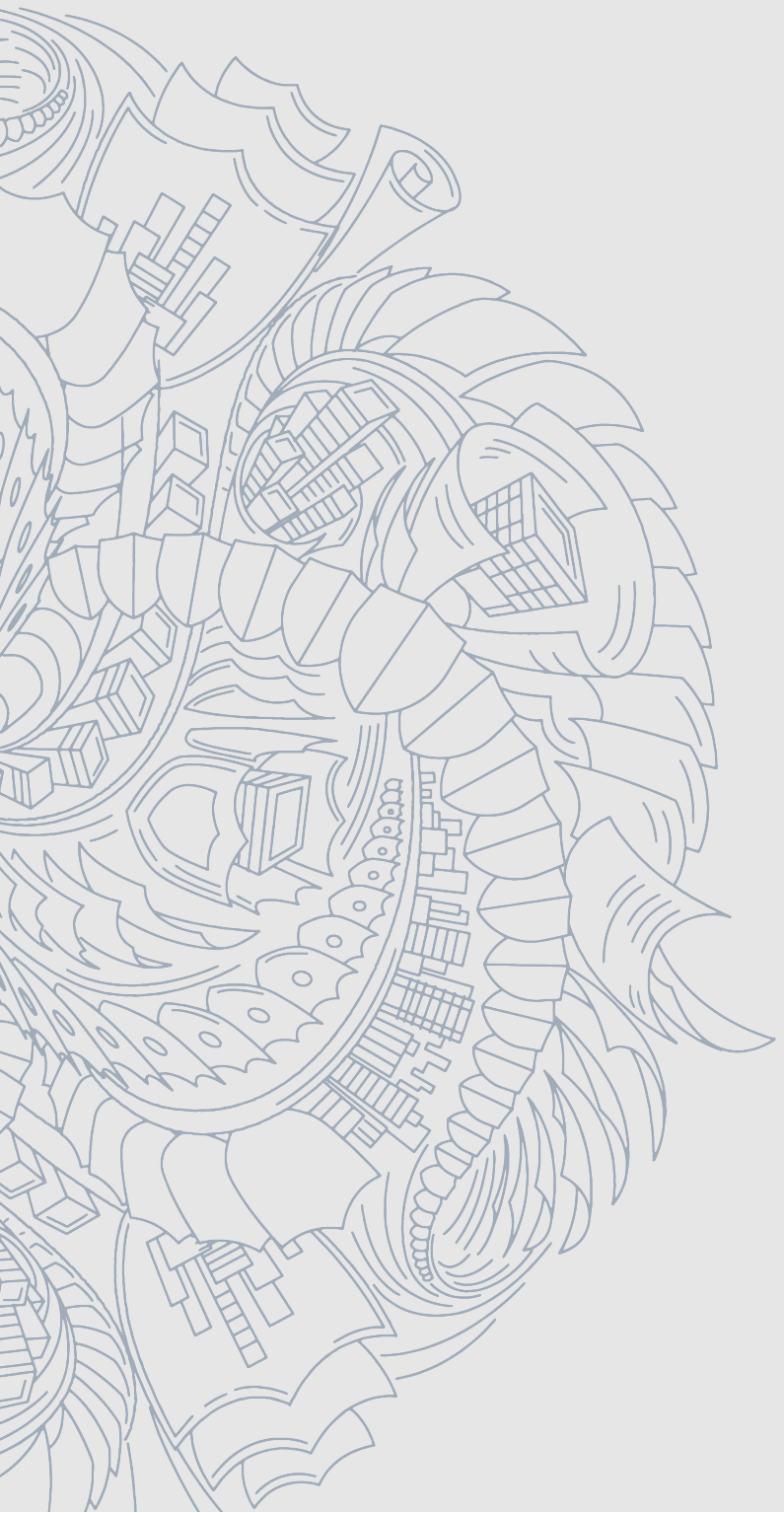
Illustration: Protecting client interests by Sam Hadley